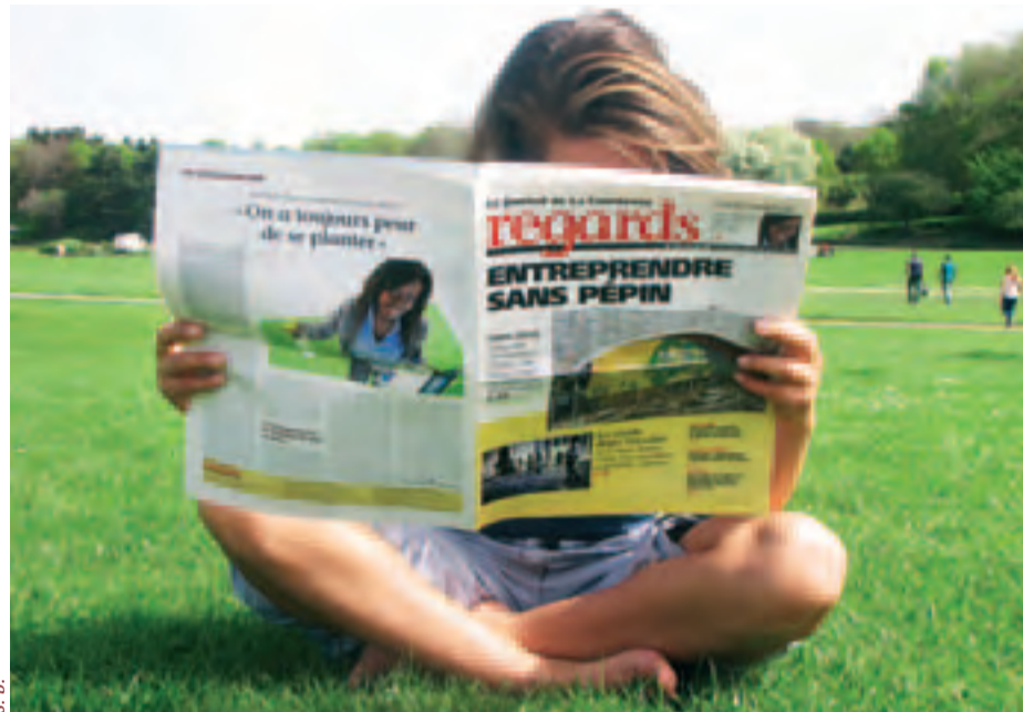
À chacun son coin de lecture.