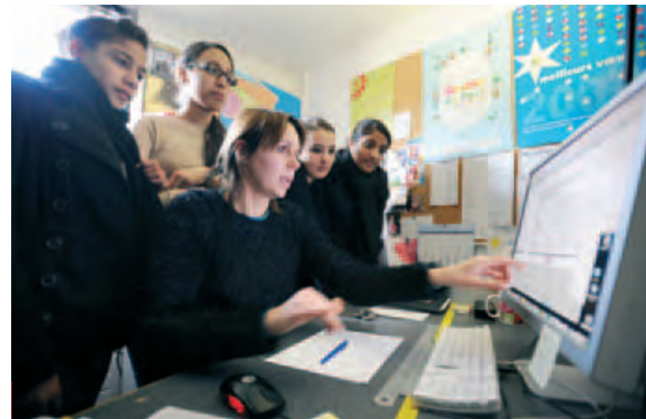
En mars dernier, une classe du collège Politzer est venue assister au montage de son propre journal.

cela demandait autant d'étapes et autant de personnes. J'ai compris que chacun avait un rôle bien précis », confie-t-elle. Conscient de son rôle pédagogique, le journal souhaiterait développer ses collaborations avec le milieu scolaire dans les mois à venir au travers d'une exposition, Une autre mondialisation , dédiée aux villes jumelles. S. B.