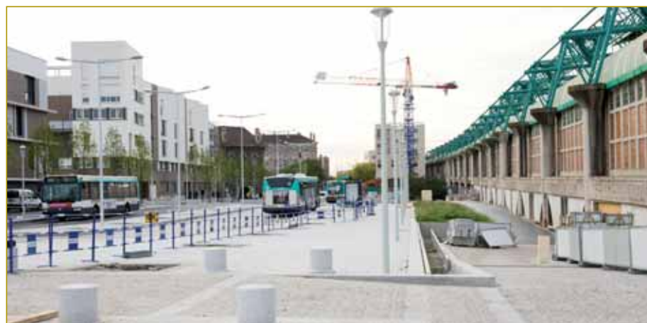
Le parvis de la gare, rue Suzanne-Masson

Le maire rappelle par ailleurs les efforts déployés pour installer des commerces autour du pôle de transports. Un supermarché Franprix, une boucherie traditionnelle ainsi qu'un laboratoire d'analyses médicales et un kiosque à journaux vont ouvrir leurs portes suite à la réhabilitation de la gare et de ses environs. Les habitants présents ne cachent pas leur satis-