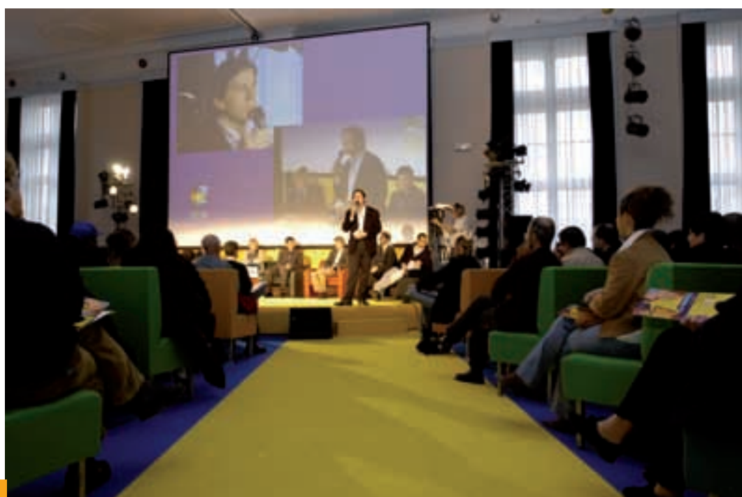
Janvier 2002, « Agitateurs d'avenir », voilà résumée les secondes Rencontres pour La Courneuve 2010.