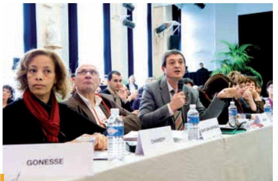
Novembre 2010, 1 eres Rencontres contre les discriminations urbaines et sociales.