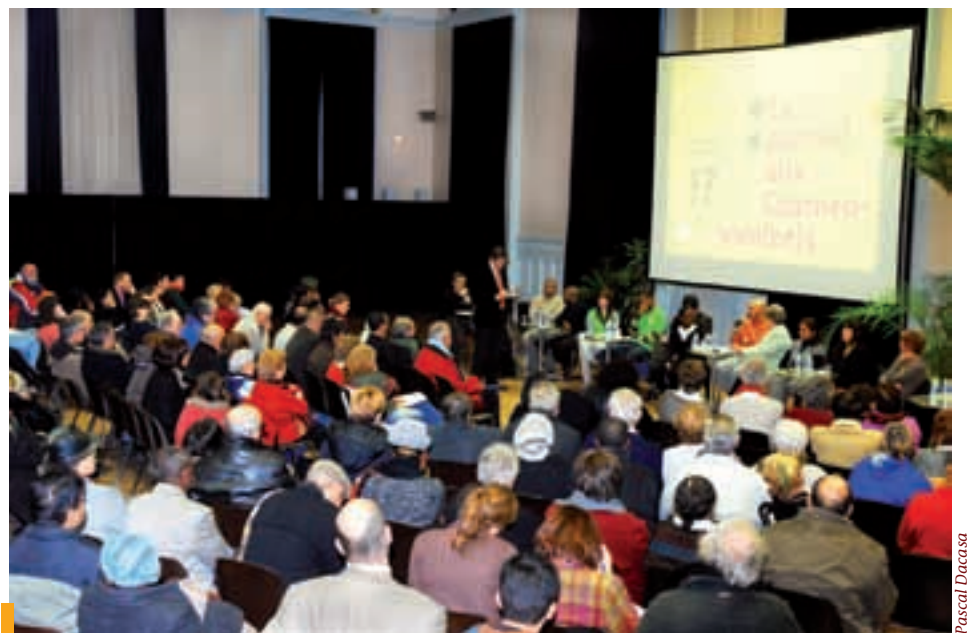
2008, Forum de la démocratie, 5 es Rencontres La Courneuve 2010.