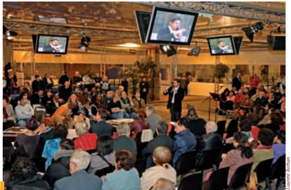
Décembre 2006, 4 es Rencontres La Courneuve 2010 à Babcock.

Propos recueillis par Isabelle Meurisse.