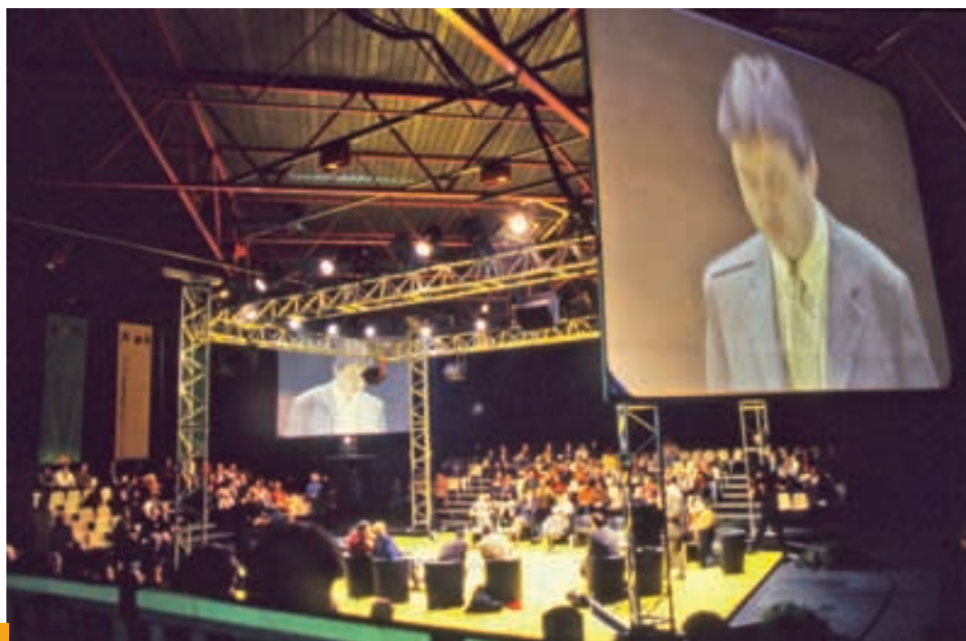
Décembre 1999, « La ville de nos souhaits », lancement des Rencontres La Courneuve 2010.